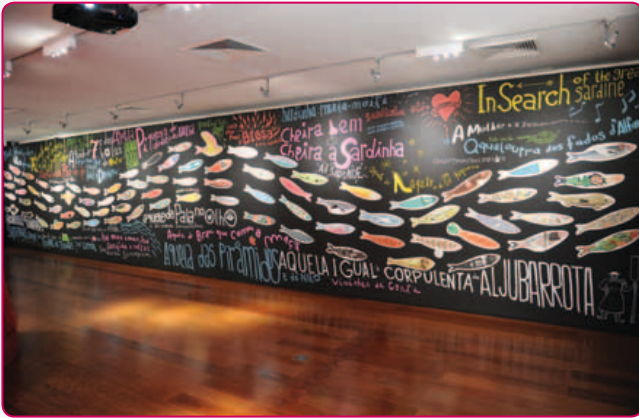
Que Sardinha És Tu!