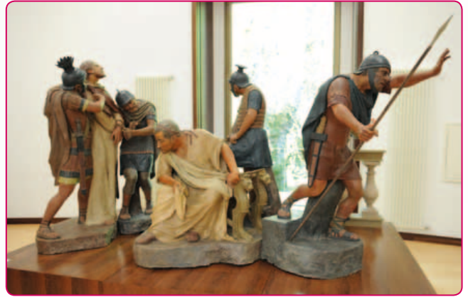
Paixão de Cristo