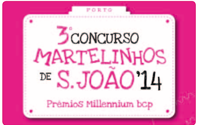
Martelinhos de S. João