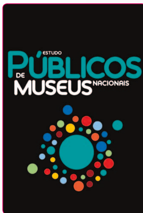
Estudo de públicos de Museus Nacionais