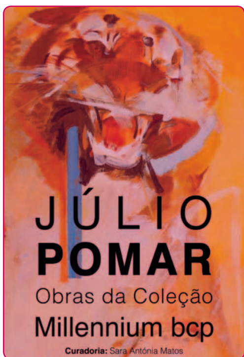
Júlio Pomar – Obras da Coleção Millennium bcp