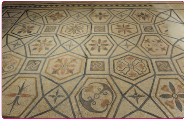
Remodelação da sala do mosaico romano do Deus Oceano