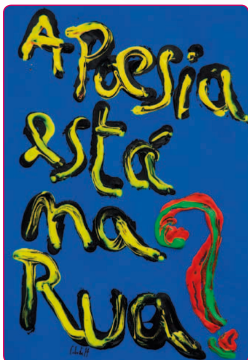
A Poesia está na Rua