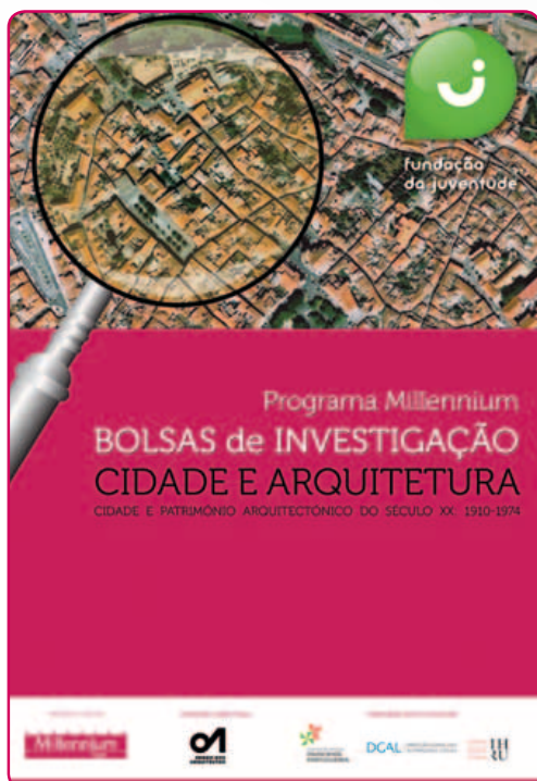
Bolsas de Investigação Cidade e Arquitetura