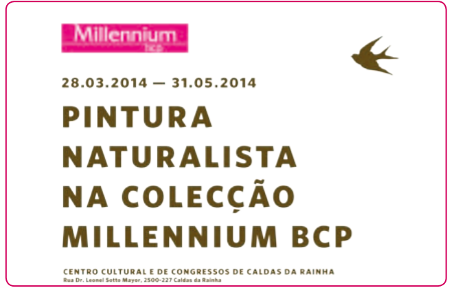
Pintura Naturalista na Coleção Millennium bcp