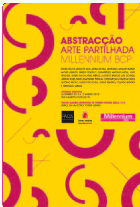
Abstracção, Arte Partilhada Millennium bcp