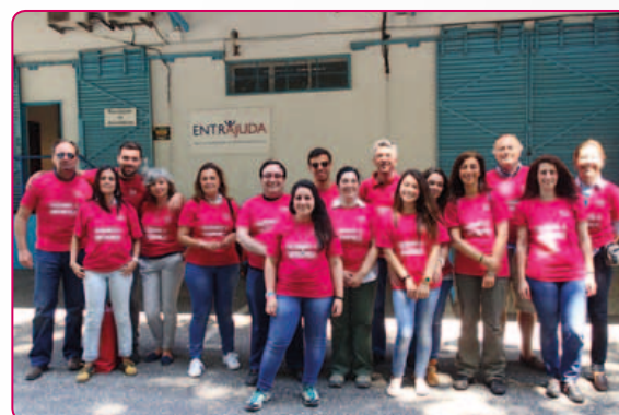
Banco Alimentar Contra a Fome