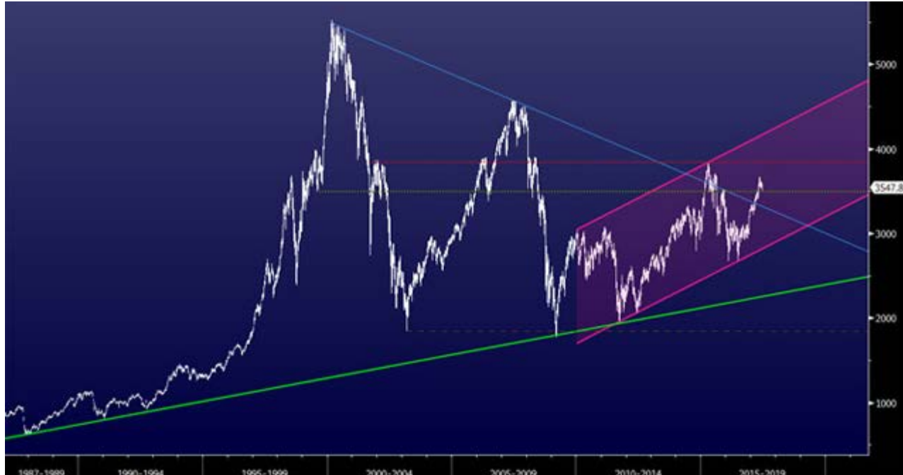
Cotação do Euro Stoxx 50 em barras semanais (a branco) e enquadramento técnico (linhas coloridas)

Fonte: Millennium investment banking, Bloomberg