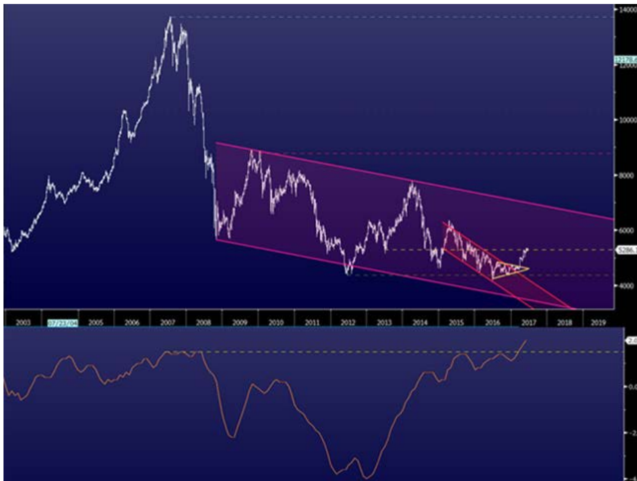
Gráfico superior: Cotação do PSI20 em barras semanais (a branco) e enquadramento técnico

da República Marcelo Rebelo de Sousa, mostram confiança de que a partir do verão possa haver uma sinalização de melhoria de rating e acreditamos que a suceder poderia ser um importante trigger para o PSI20. A primeira indicação já foi dada com a melhoria do outlook para positivo por parte da Fitch. Até lá, temos o índice de ações em recuperação gradual. Para já, conseguiu inverter a trajetória negativa de 2015 (mostrada abaixo pelo canal a vermelho no gráfico superior), o que o deixa com espaço para rumar ao topo do canal descendente em que se enquadra desde 2008 (a rosa). A ocorrer este teste nos próximos 12 meses poderíamos ter o PSI20 acima dos 6.600 pontos (ganho potencial de 25,1% face ao fecho de 16 de junho). Uma ultrapassagem desta barreira daria ainda mais conforto aos investidores, pois teoricamente projetaria o índice para um patamar acima dos 10.000 pontos. Para manter este padrão de otimismo é conveniente que em correções de curto prazo que possam ocorrer no 3º trimestre consiga ficar acima dos 4.700 pontos, sendo que o nível mais crítico encontra-se pelos 4.350 pontos (linha tracejada a verde).