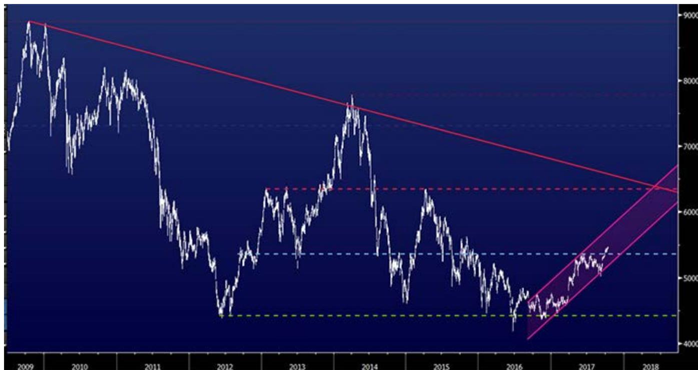
Cotação do PSI20 em barras diárias (branco) e enquadramento técnico (linhas coloridas)

Os ventos são neste momento favoráveis ao mercado de ações nacional e isso traduz-se num padrão técnico apelativo, em termos teóricos claro. Cerca de um ano depois de ter reagido em alta aos mínimos de 2012 (linha tracejada a verde na imagem abaixo), o PSI20 apresenta um enquadramento positivo (canal a rosa). E há muitas semelhanças em termos de padrão de recuperação com o movimento encetado há 5 anos, com mais estabilidade agora, pois o movimento é feito de forma mais gradual (sustentada). Ora, se assim for, após uma fase de consolidação entre maio e setembro o índice pode estar a preparar-se para novo arranque. E se como diz o ditado "se os astros estiverem alinhados" poderíamos ver o PSI20 atingir os 6.400 pontos (ganho potencial de 17% face à cotação de fecho de 13 de outubro) junto ao final do 1º semestre de 2018, ou seja, daqui a 9 meses. Para manter estas perspetivas positivas é essencial que continue acima da base deste enquadramento (o tal canal a rosa), pelo que para investidores em PSI20 através de instrumentos como certificados pode justificar-se a colocação de uma ordem stop loss nos 5.200 pontos, para travar quedas derivadas da inversão de sentimento.