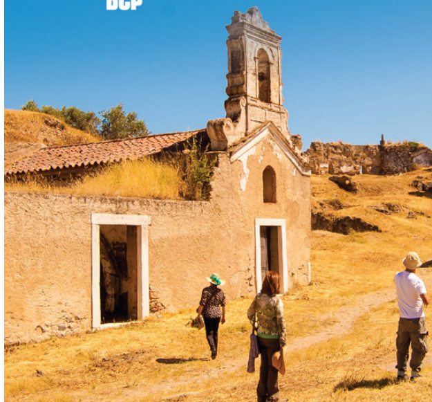
Estudo “Património Cultural em Portugal: Avaliação do Valor Económico e Social”.