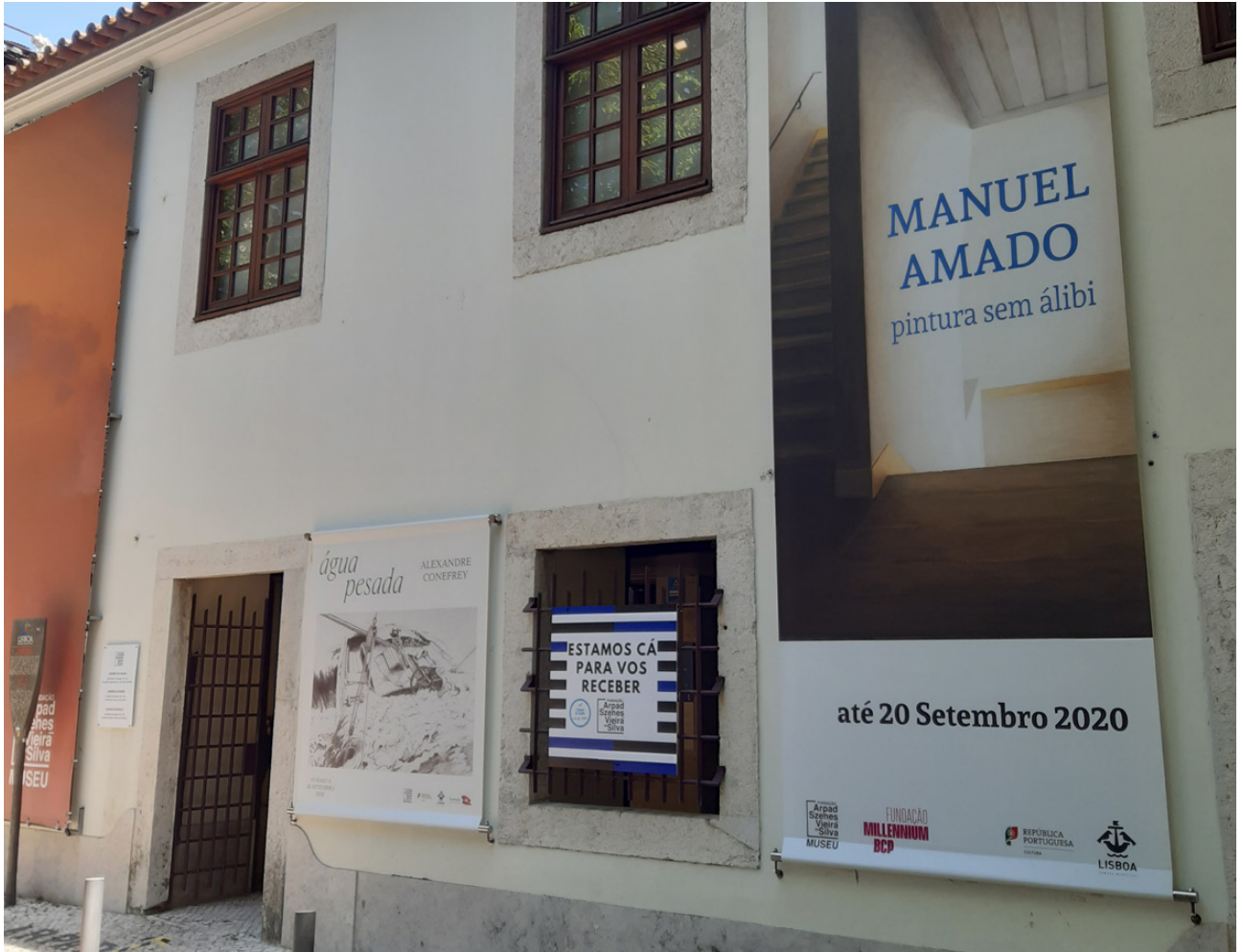
Exposição "Manuel Amado – Pintura sem álibi", que esteve patente na Fundação Arpad-Szenes Vieira da Silva, em Lisboa.

A extensão e profundidade dos impactos provocados pela Covid-19, que levou a um agravamento muito significativo das condições de vida e de isolamento das populações mais fragilizadas, motivou um especial acompanhamento e apoio aos projetos lançados com o intuito de minorar os efeitos desta pandemia.