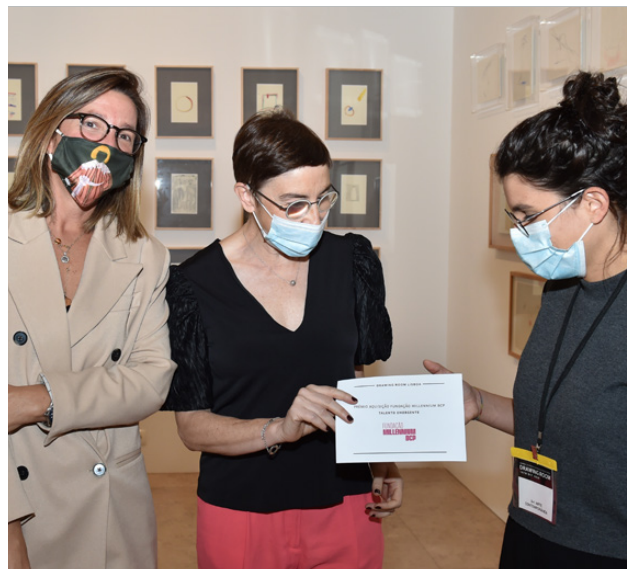
“Drawing Room Lisboa 2020”.