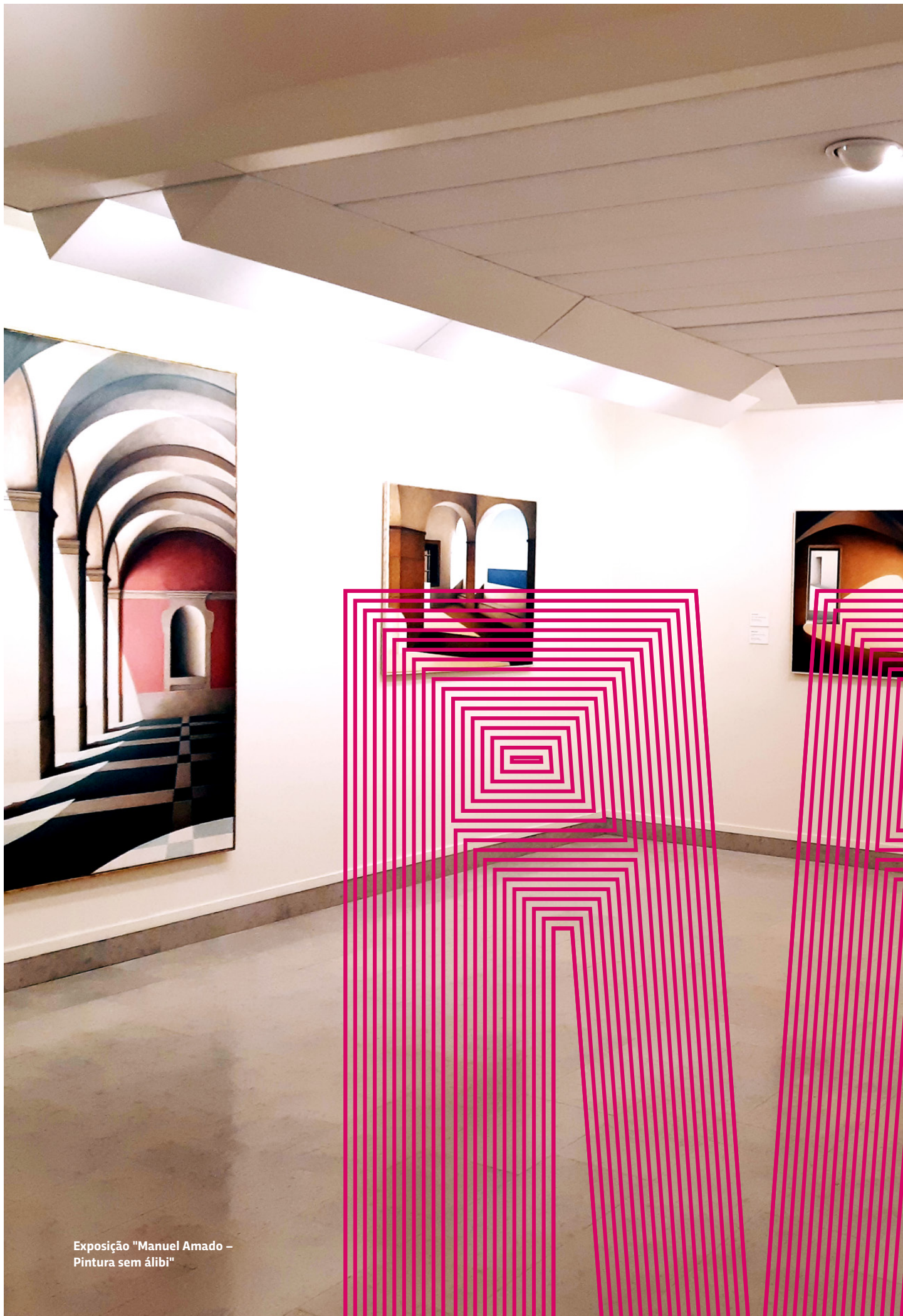
Exposição "Manuel Amado – Pintura sem álibi"