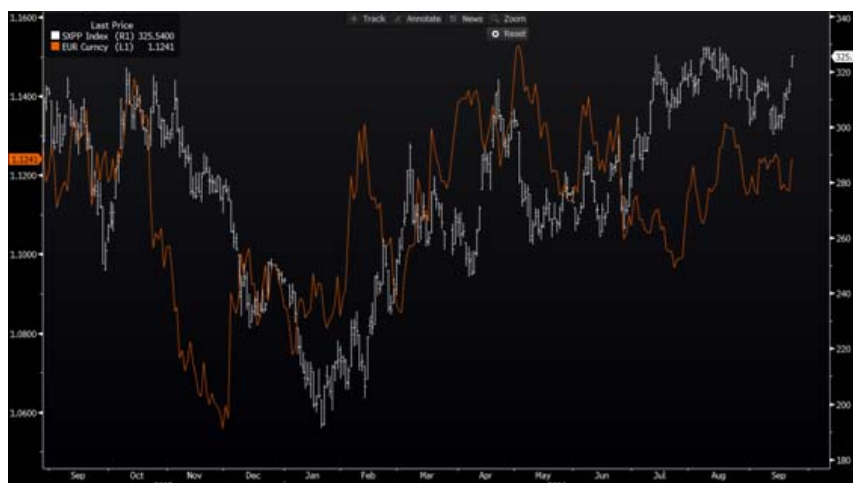
Evolução do setor de Recursos Naturais e Euro/Dólar