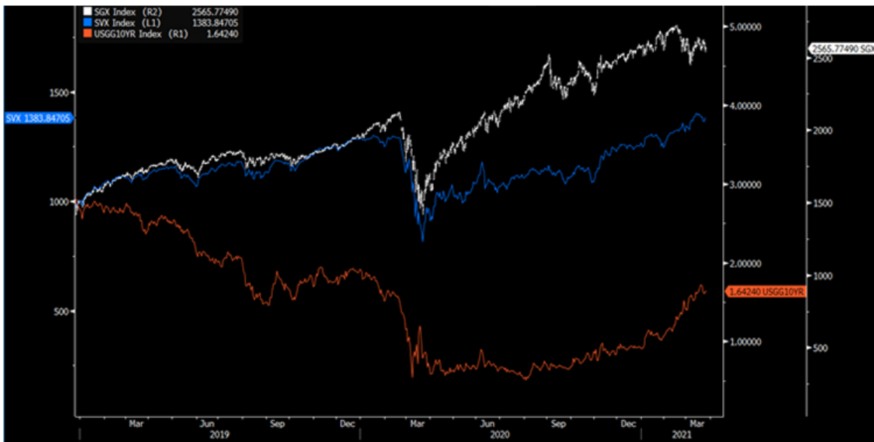
S&P 500 Value (azul) e S&P 500 Growth (branco) Taxa de juro da dívida soberana dos EUA a 10 anos (laranja)

Concluindo, numa ótica de diversificação do investimento, um mix entre o Value e Growth continua a fazer sentido na gestão da carteira do investidor, e, nesse sentido, é natural que nestes meses na Europa haja igualmente atenção a empresas de elevada Dividend Yield . Na sua estação de negociação e App MTrader, separador Notícias, pode encontrar diariamente ampla informação sobre este e outros temas que impactam os mercados de ações.