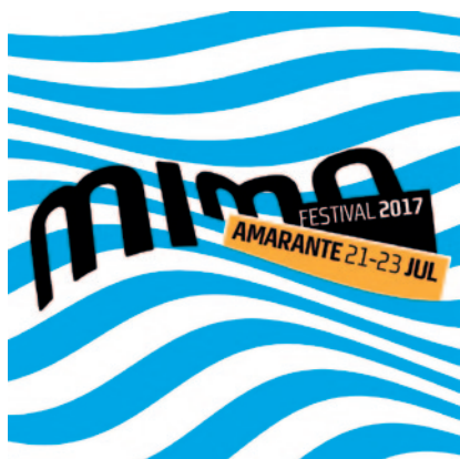
O Festival Mimo 2017 contou com 196 participantes.