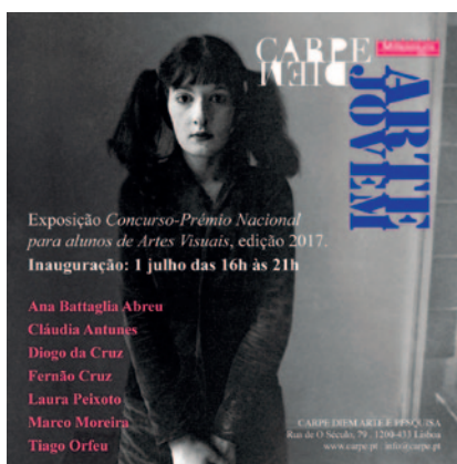
O Concurso-prémio nacional Arte Jovem visa dar a conhecer novos artistas.