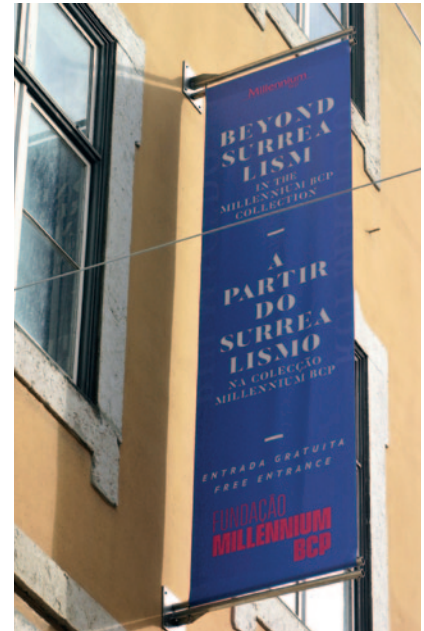
A Partir do Surrealismo reúne obras de oito artistas da Coleção Millennium bcp.

A CULTURA É O EIXO PRIORITÁRIO DA ATIVIDADE DA FUNDAÇÃO.